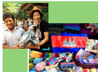
カンボジアで作ったモノをフェアトレードとして販売します。