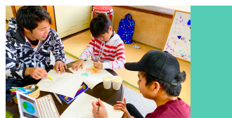
高校生、大学生が日本語サポートに挑戦！ 国を越えた共に学ぶ支援(共生) ^_^