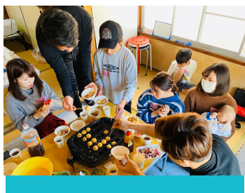
マンスリーランチ交流会で心のグローバル化