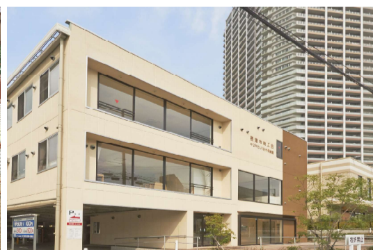
みなみせんりおか遊育園