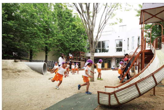
とりかいひがし遊育園